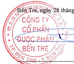
Nguyễn Thiện Nhân Người lập