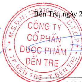
Nguyễn Thiện Nhân Người lập